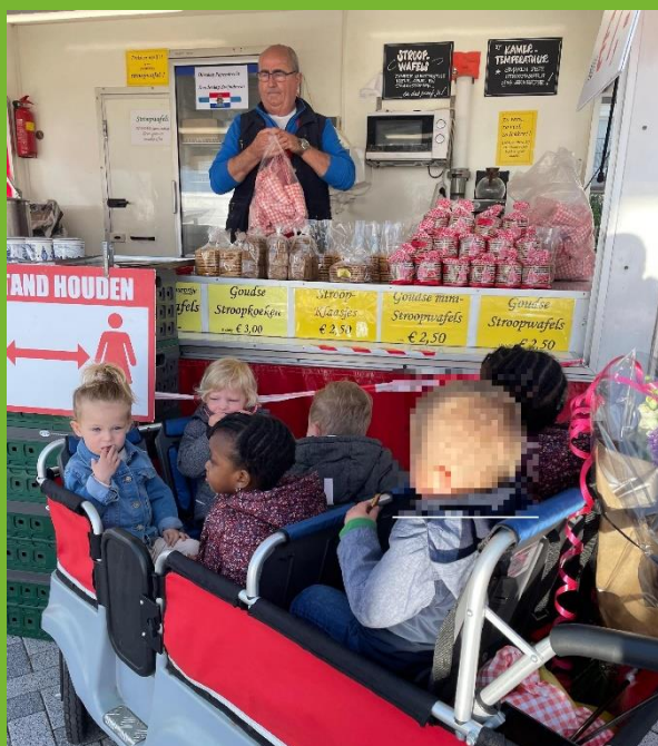
Samen naar de markt!

Christelijk kindcentrum Juliana kinderopvang & basisonderwijs