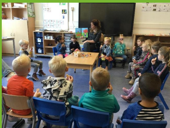
Met de peuters op bezoek bij de kleuters!

De komende periode gaan de peuters spelenderwijs (meer) ontdekken en zich verwonderen over het thema kriebelbeestjes. De ouder(s) en/of verzorger(s) hebben via het ouderportaal een themabrief ontvangen met tips en leuke ideeën om samen met hun zoon of dochter thuis te kunnen doen. Het prentenboek 'Rupsje Nooitgenoeg' zal een hoofdrol spelen. Deze week hebben de peuters een rups geverfd.